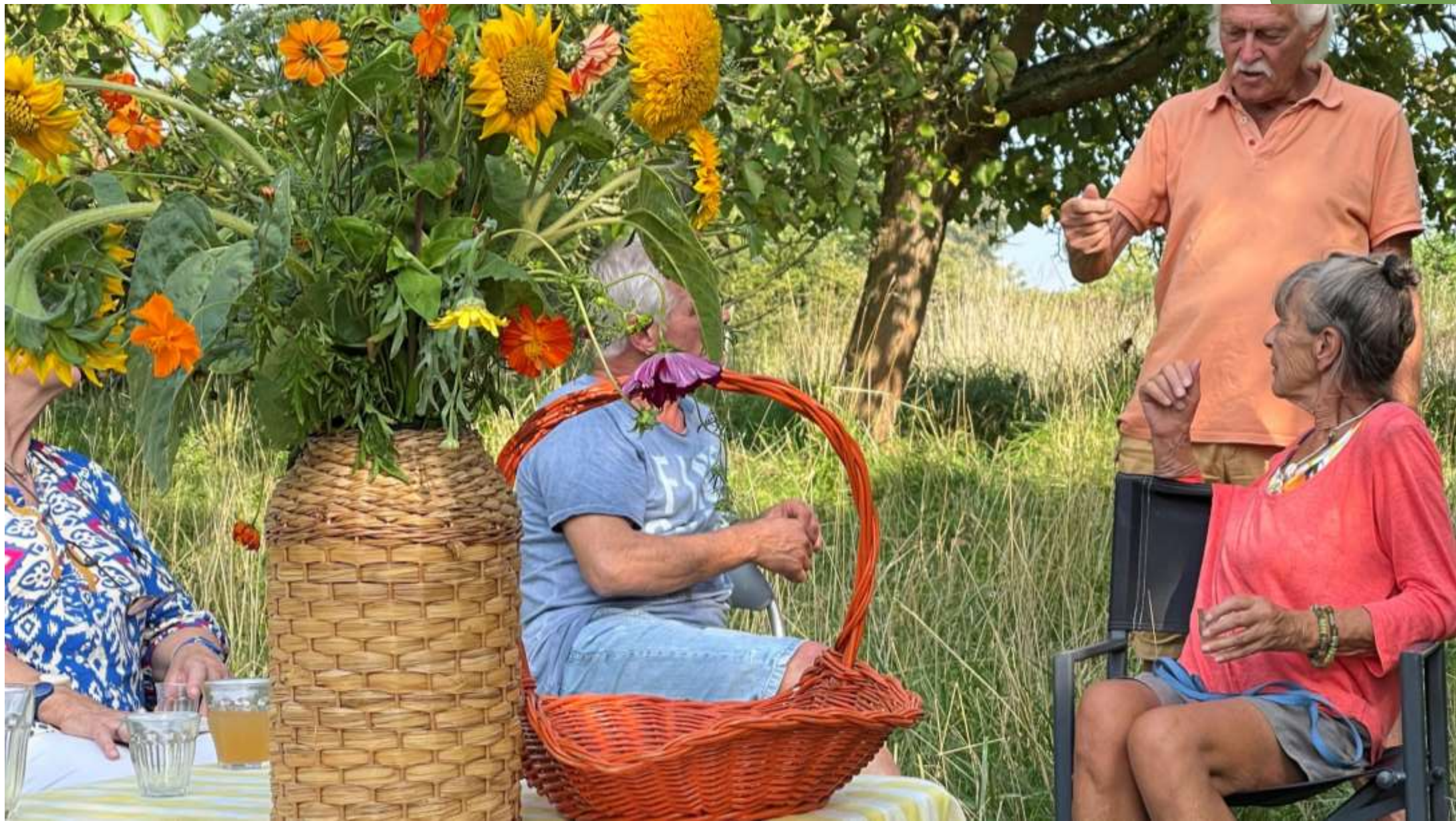
Praten met belangstellenden over de mogelijkheden van de boomgaard