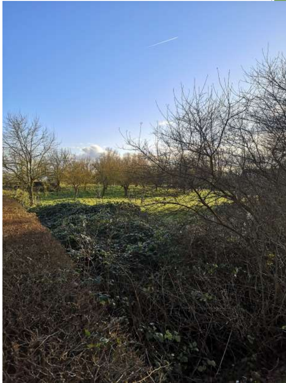
Welkom in de Hoogstam boomgaard Veere